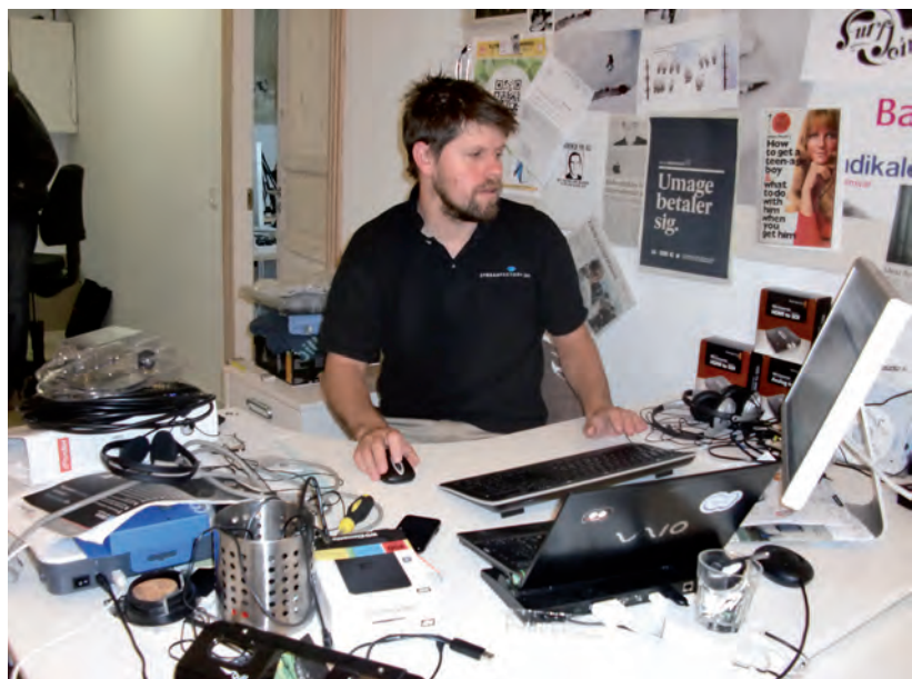
En virksomhed behøver ikke at fylde meget nu om dage

Han søger fortsat inspiration gennem det kon-