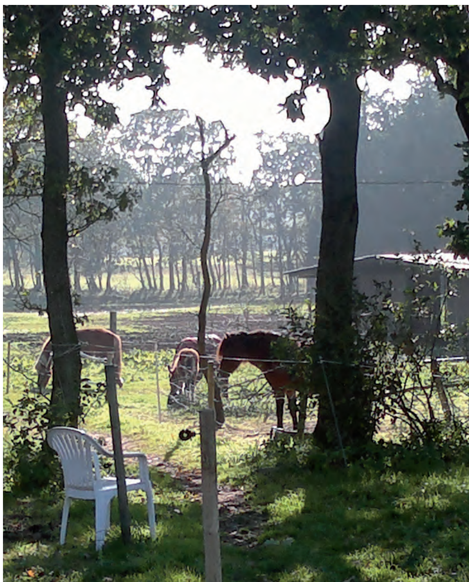
Billedet af det gode liv?