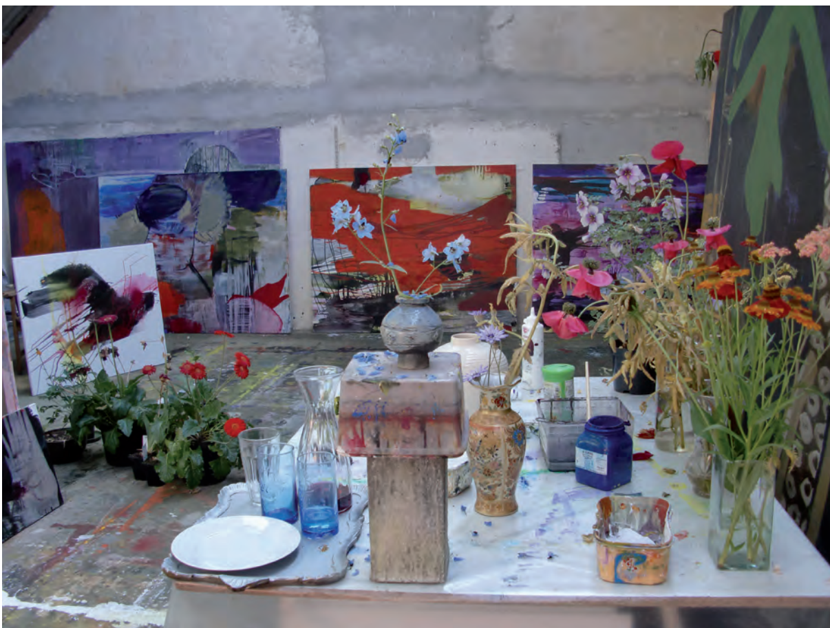
Ulla lever af at male sine blomster og naturen omkring sig.

Hun finder behov for en økonomisk buffer og om muligt understøtning og aflastning, f.eks. ved produktion af rammer til sine billeder eller til administration/drift af selve virksomheden. "Måske udvikle et netværk eller partnerskab, til deling og udveksling af services?", spurgte red.