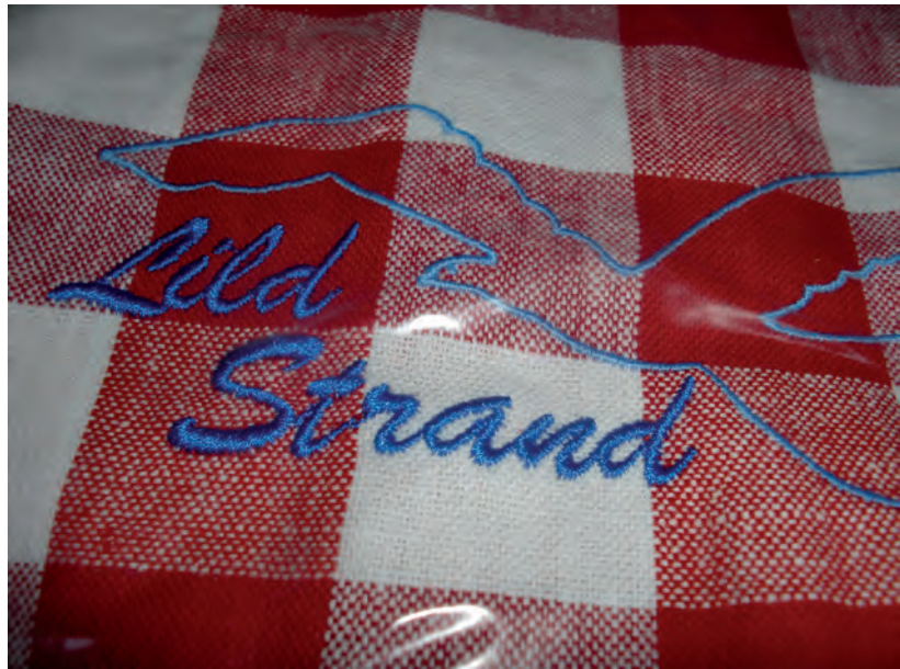
Hawhuset ligger naturligvis på Lild Strand.

AN har selv tidligere været optaget af genbrug og gruppen har i øvrigt fælles interesser i bl.a. hånd-