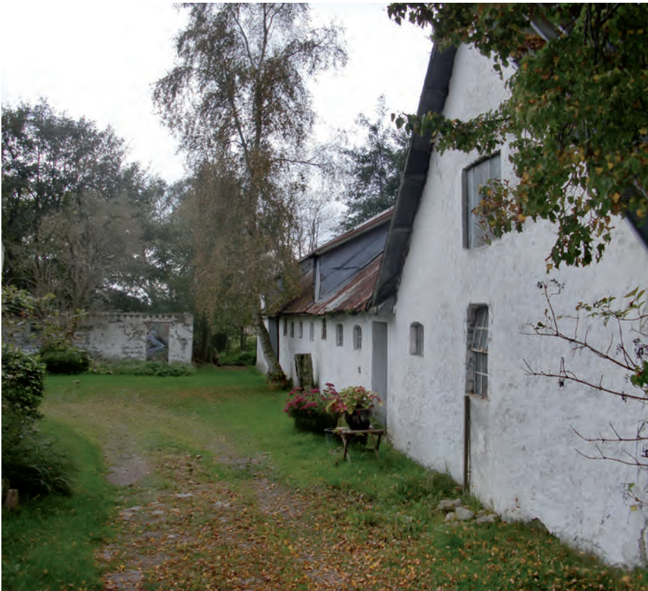
Nedlagte landbrugsejendomme er et mekka for nye typer iværksættere.