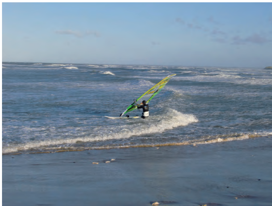
Også en iværksætter?

Det handler også om evt. forskelle, som kan relateres til den forskellige beliggenhed i landet 10 .